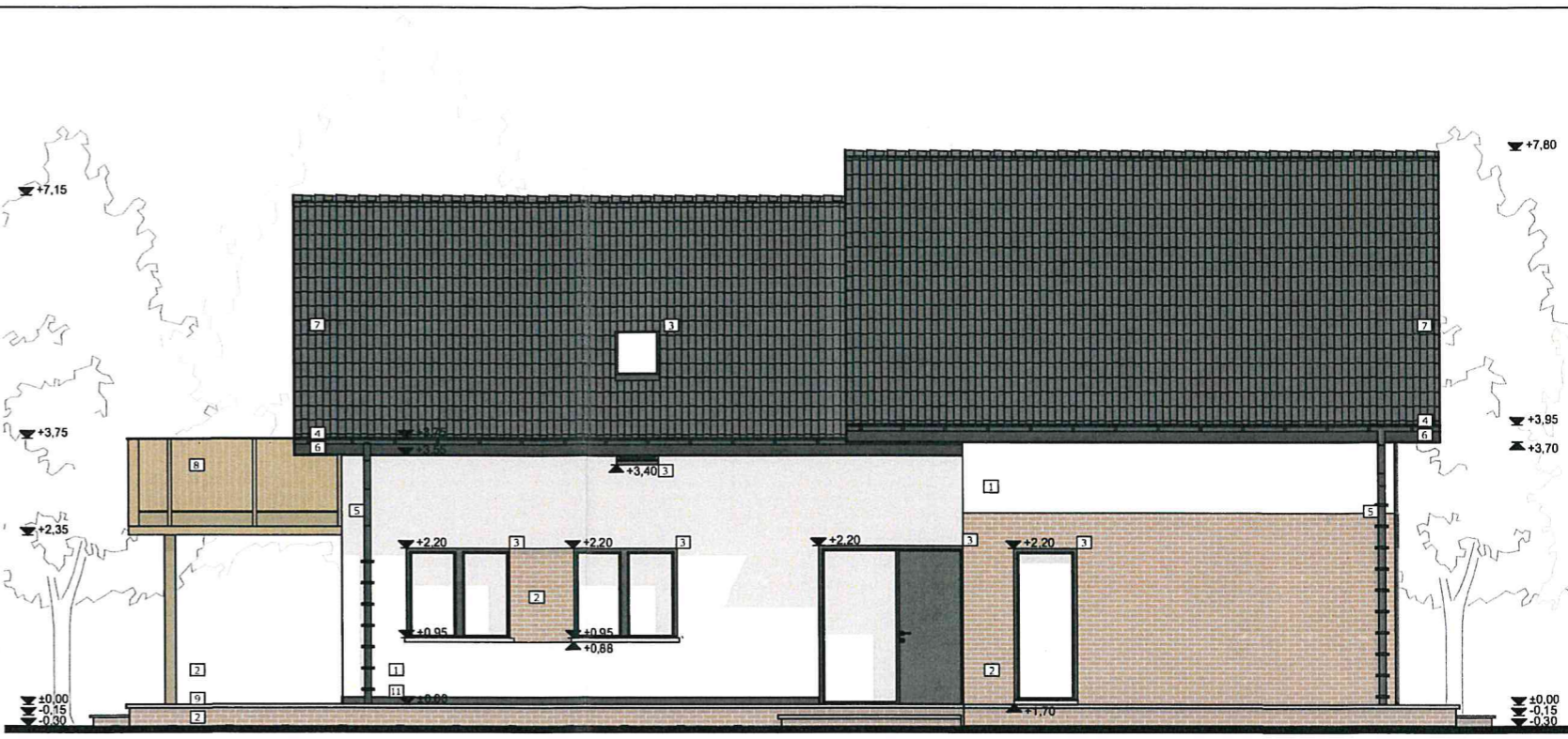
FATADA LATERAL STANGA